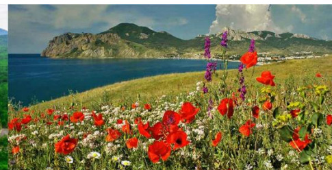
Восточный Юг России