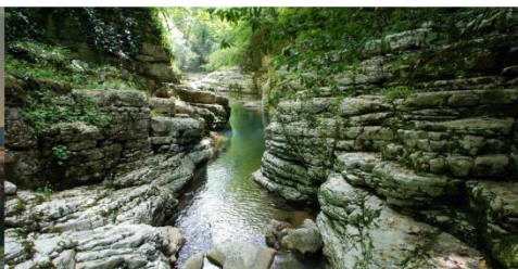
Западный Юг России