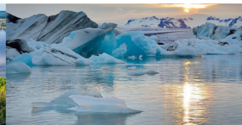
Русский Север и Арктика