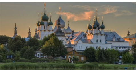
Большое Золотое кольцо

Поволжский государственный университет физической культуры, спорта и туризма