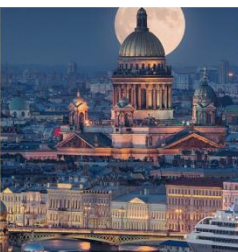
Из г. Москвы в г. Санкт-Петербург