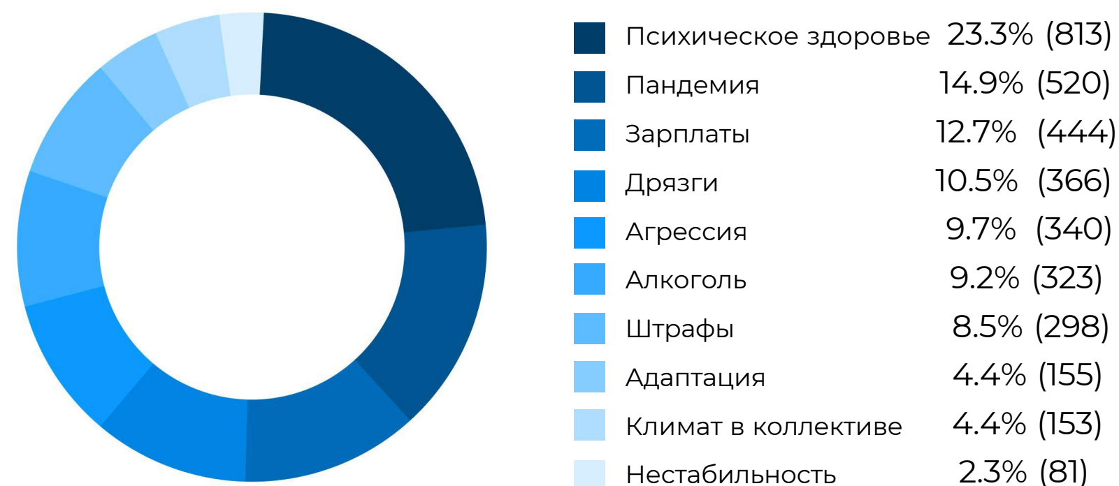
Распределение по тегам: Причины (Мужчины)