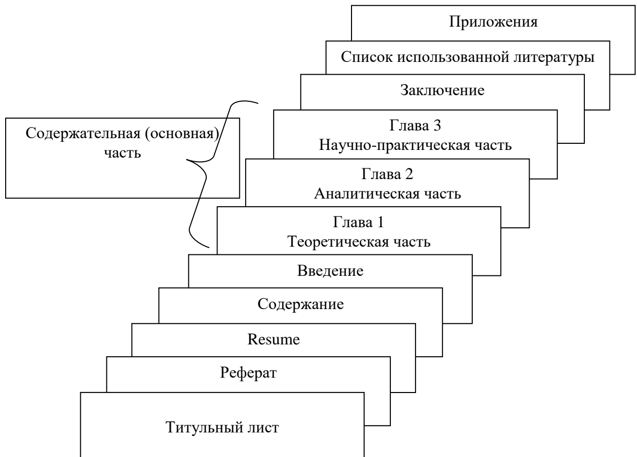
Рисунок 1 - Композиция (последовательность) структурных элементов ВКР

Структура ВКР должна соответствовать утвержденному научным руководителем плану и, как правило, состоять из следующих частей (рисунок 1): титульного листа, задания на ВКР, реферата, оглавления, введения, обозначений и сокращений (при необходимости), основной части (глав и параграфов), заключения, списка использованной литературы, приложений, графической части (иллюстрационный материал/презентация). Общий объем ВКР без приложений – 60-70 страниц.