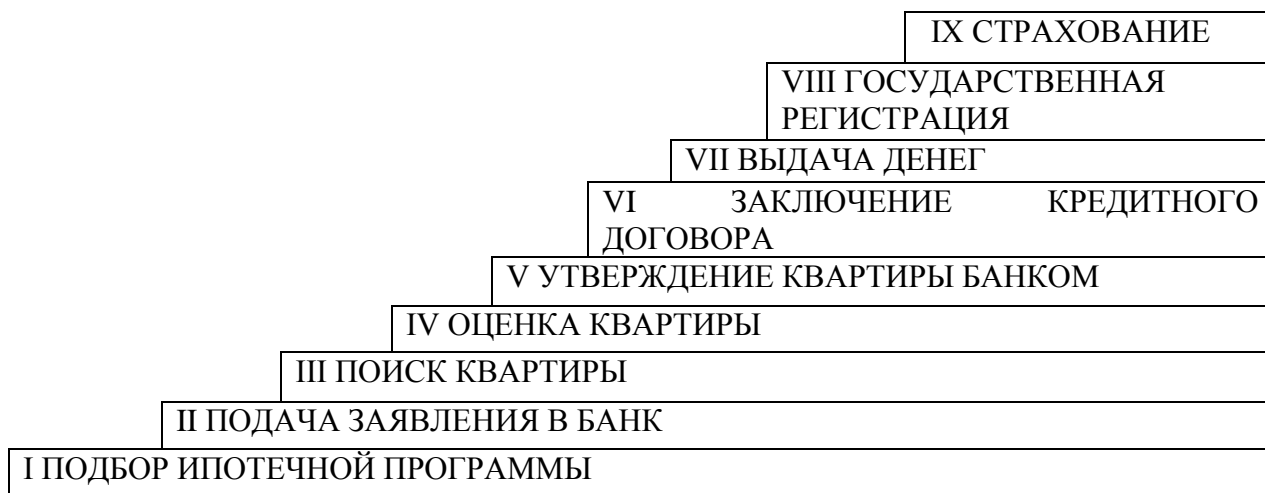
Рис. 2 Этапы приобретения квартиры с помощью ипотечного кредита