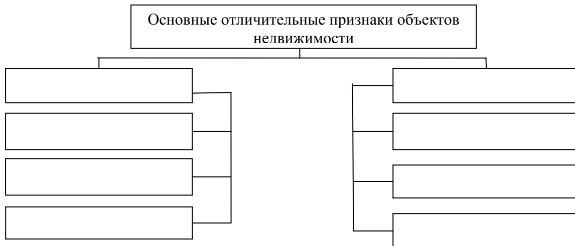
Рис. Основные отличительные признаки объектов недвижимости

27. Задание 2. Объясните, в каких случаях ценность всех объектов недвижимости на территории города может быть примерно одинаковой.