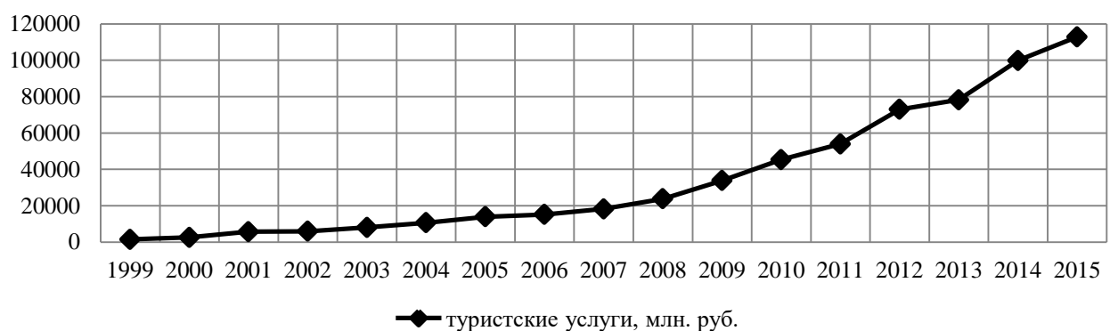
Рисунок 1 – Динамика оказания туристских услуг за период 1999-2015 гг. Источник: http://www.fedstat.ru/indicators/start.do

Основными показателями, характеризующими развитие туристской отрасли, являются динамика и структура туристских поездок, общее количество туристов, въехавших, выехавших из страны или путешествующих внутри нее, выручка от реализации туристских услуг, число турфирм. Ниже представлена характеристика перечисленных показателей.