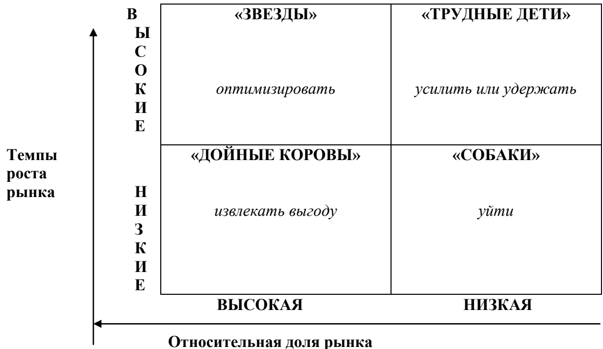
Рис. 1. Матрица БКГ «Рост-доля рынка»

Рынок клининговых услуг в целом можно отнести к быстрорастущим, однако на различных потребительских и продуктовых сегментах ситуация значительно отличается.