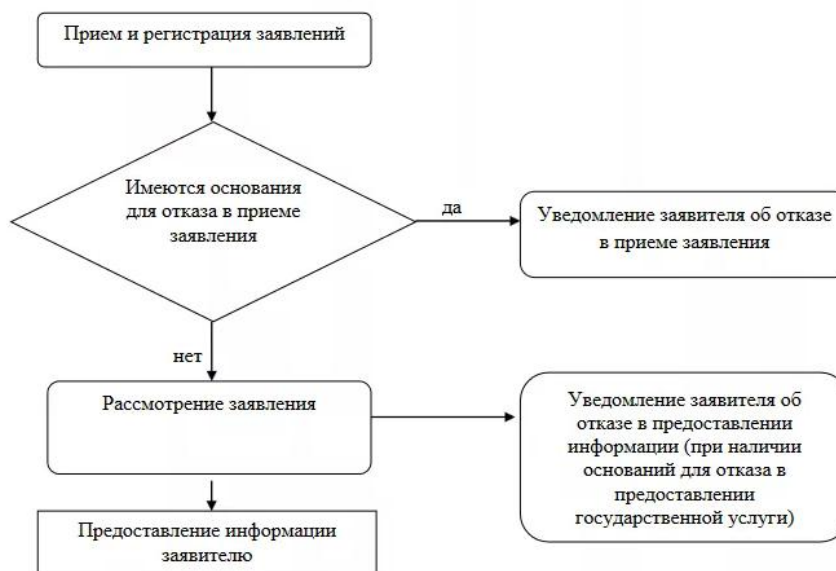
Блок-схема предоставления государственной услуги