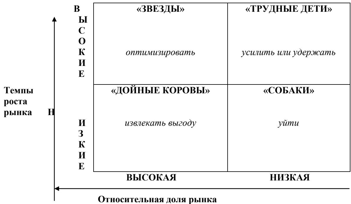
Рис. 1. Матрица БКГ «Рост-доля рынка»

Рынок клининговых услуг в целом можно отнести к быстрорастущим, однако на различных потребительских и продуктовых сегментах ситуация значительно отличается.