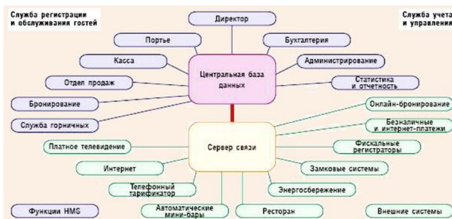
Рис. Схема взаимосвязей гостиницы, осуществляемых с помощью АСУ

- перечень популярных АСУ в Российской Федерации