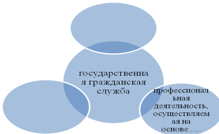
Рис. 1. Признаки, характеризующие гражданскую службу