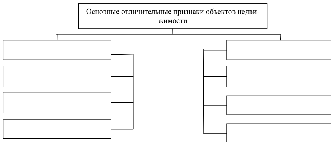
Рис. Основные отличительные признаки объектов недвижимости

27. Задание 2. Объясните, в каких случаях ценность всех объектов недвижимости на территории города может быть примерно одинаковой.